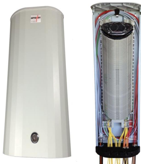
OptoPoint TWO Typ E mit Bodentyp I