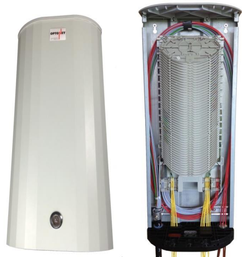
OptoPoint TWO Typ D mit Bodentyp I